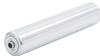
硬質クロムメッキ