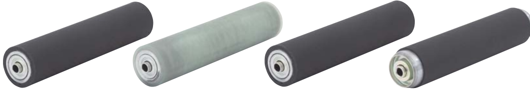
天然ゴムライニング