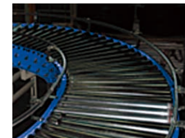
EC 型(高速カーブタイプ)